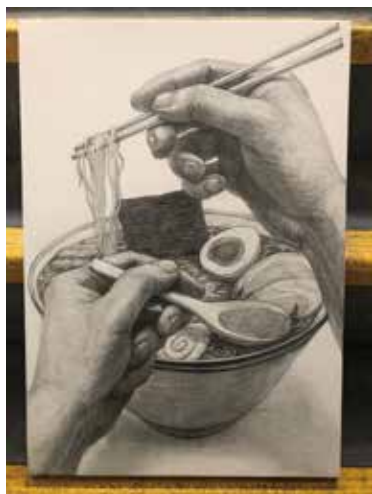
▲屋外の日陰で撮影

各自が自分の作品をできるだけ良い状態でみてもらえるように気遣いをすることが大切です。